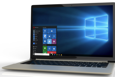
Offene Desktop Session

Die Umsetzung der Secure Session als verdeckte, nicht sichtbare und damit geschützte Windows Sitzung verhindert unbefugte Zugriffe und Ausspähungen bei automatisch optimaler Konfiguration der jeweiligen Desktop Session.