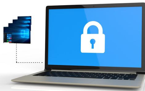
X1: Verdeckte, parallele Secure Sessions